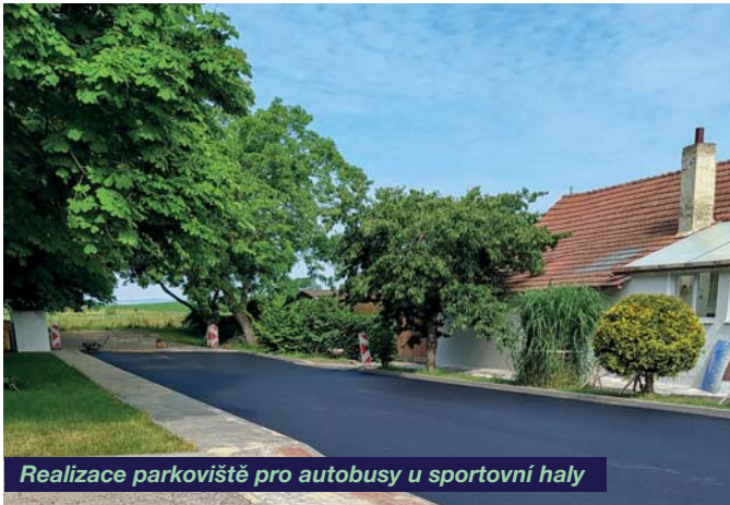
Realizace parkoviště pro autobusy u sportovní haly