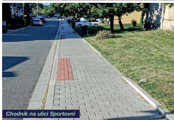
Chodník na ulici Sportovní