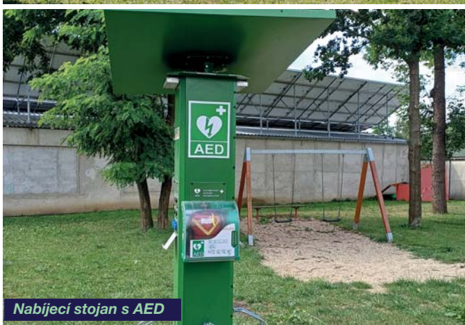
Nabíjecí stojan s AED