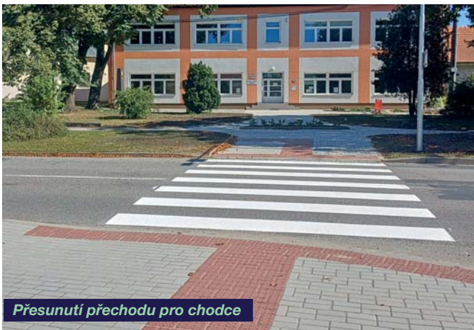
Přesunutí přechodu pro chodce