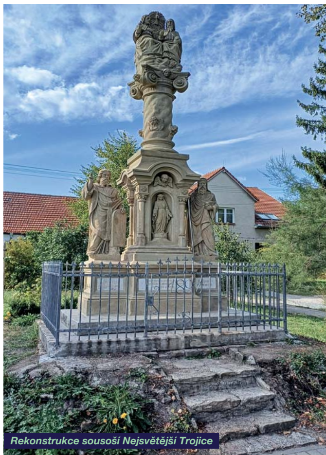
Rekonstrukce sousoší Nejsvětější Trojice