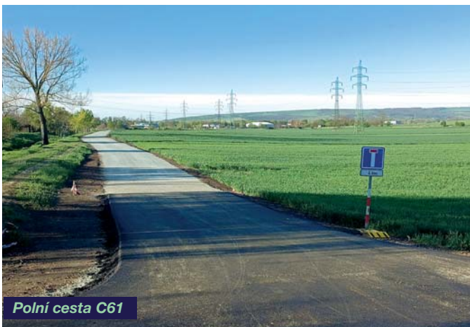
Polní cesta C61