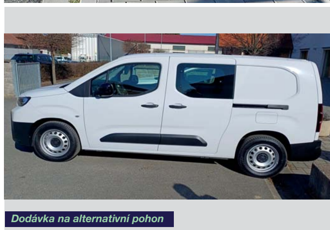
Dodávka na alternativní pohon