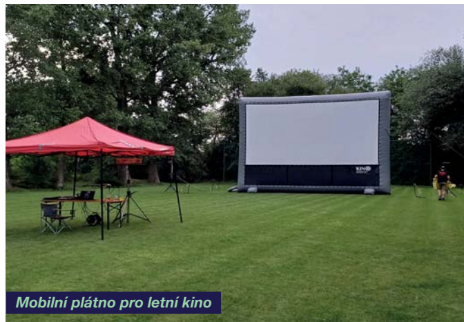
Mobilní plátno pro letní kino