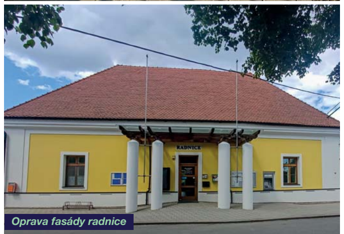
Oprava fasády radnice