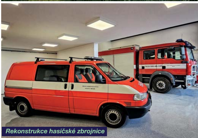
Rekonstrukce hasičské zbrojnice