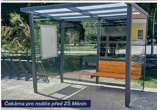
Čekárna pro rodiče před ZŠ Měnin