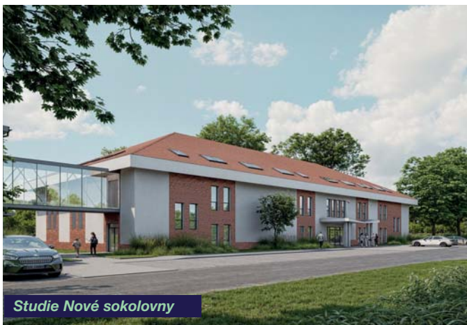
Studie Nové sokolovny