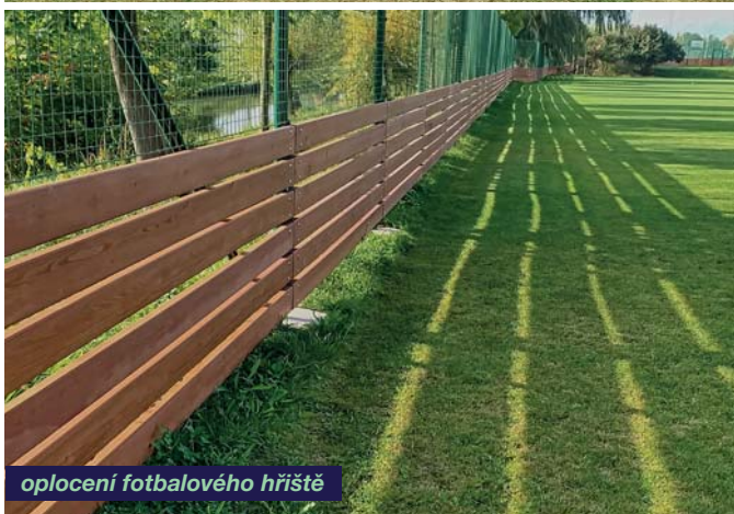
oplocení fotbalového hřiště