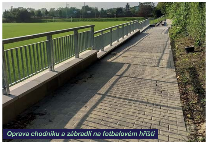
Oprava chodníku a zábradlí na fotbalovém hřišti