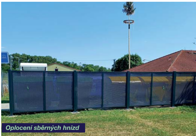
Oplocení sběrných hnízd