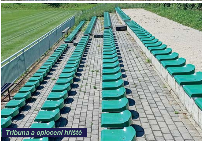
Tribuna a oplocení hřiště