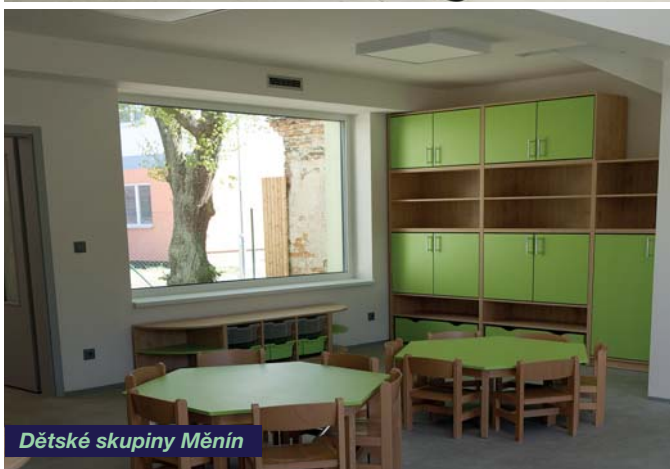
Dětské skupiny Měnin