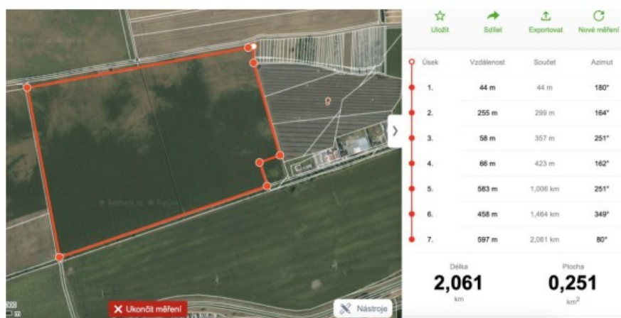
Obr. 1 Situační náčrtek řešeného území p.č. 2636